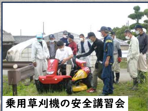
乗用草刈機の安全講習会