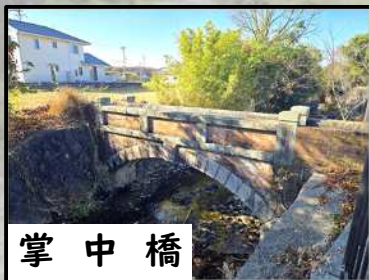
掌 中 橋