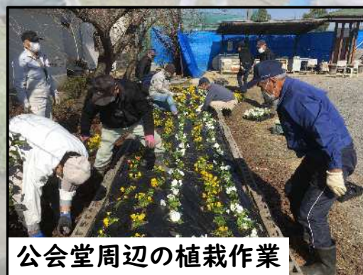
公会堂周辺の植栽作業