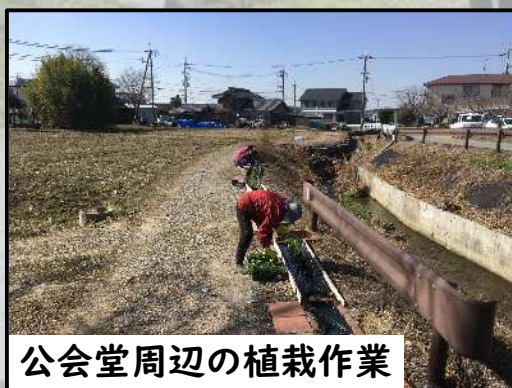
公会堂周辺の植栽作業