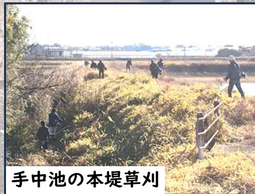
手中池の本堤草刈