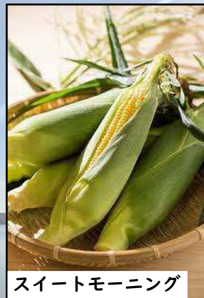
スイートモーニング