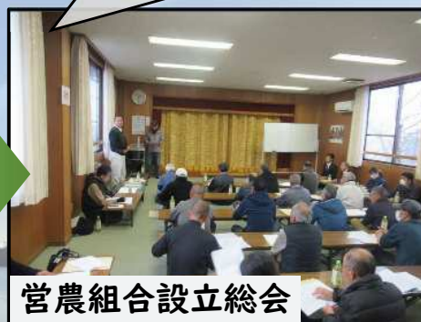
営農組合設立総会