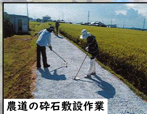
農道の碎石敷設作業