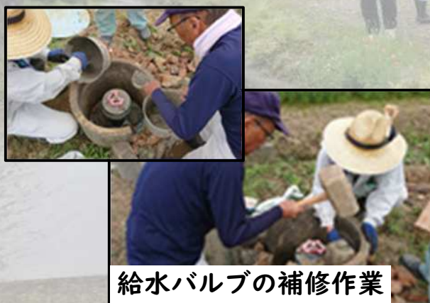
給水バルブの補修作業