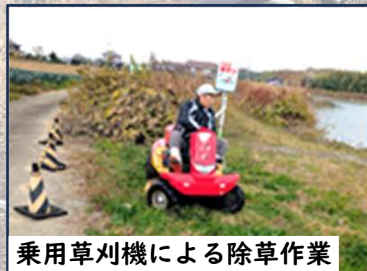
乗用草刈機による除草作業