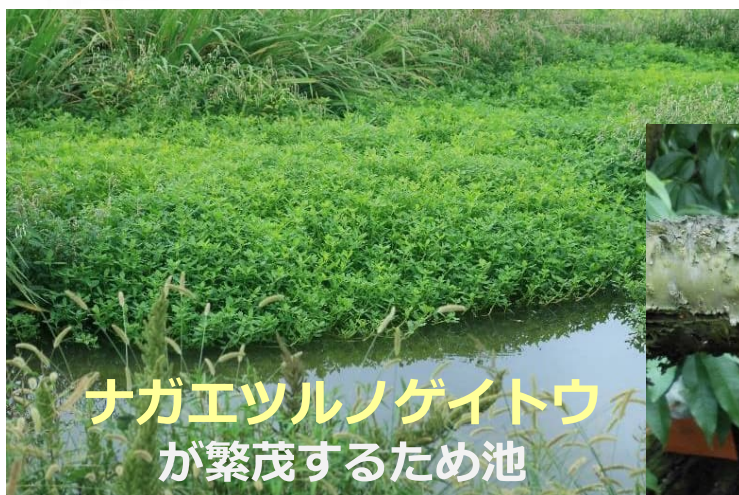
ナガエツルノゲイトウ が繁茂するため池