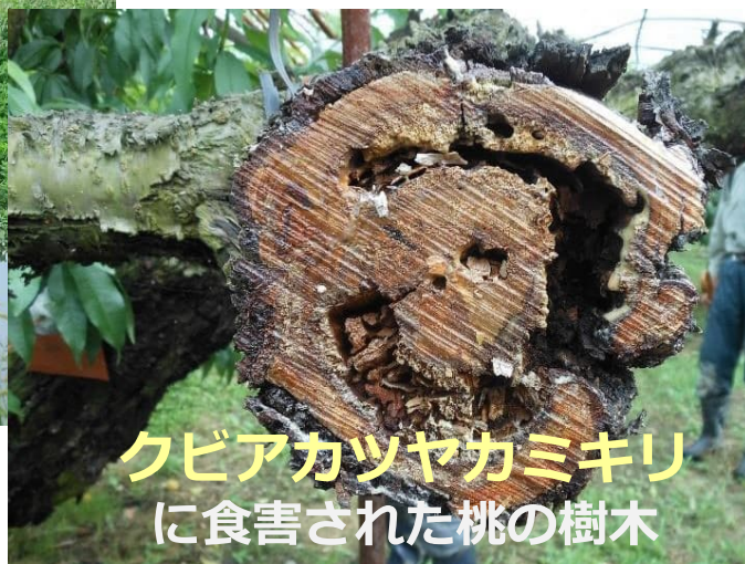
クビアカツヤカミキリ に食害された桃の樹木