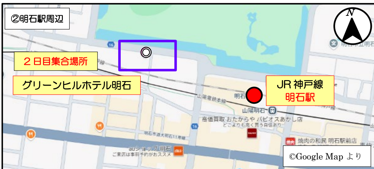
② 2日目集合場所(グリーンヒルホテル明石前)※当センター手配のバスをご利用される方