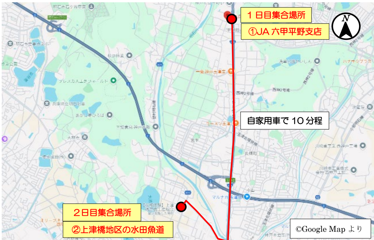
図 JA 六甲平野支店～現地見学場所への経路