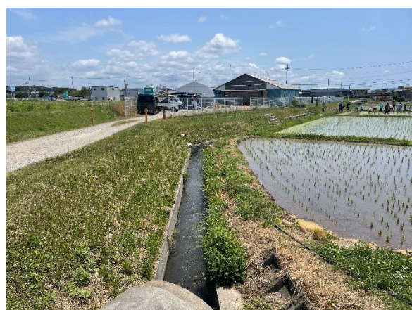
②集合場所(2 日目)の風景