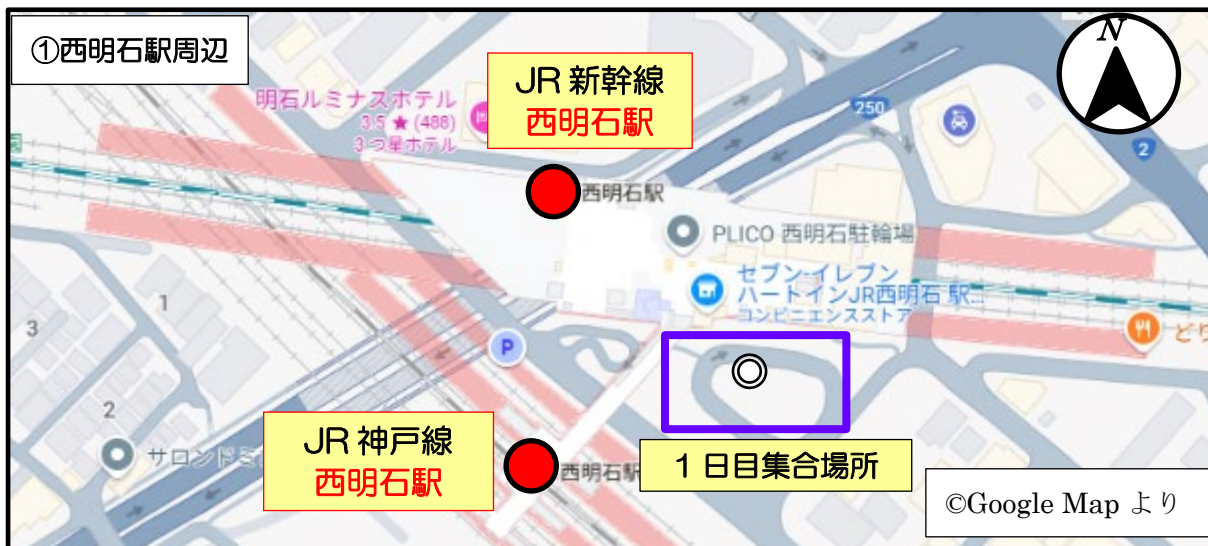
① 1日目集合場所(西明石駅ロータリー)※当センター手配のバスをご利用される方