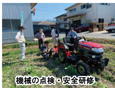
機械の点検・安全研修