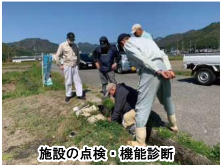
施設の点検・機能診断