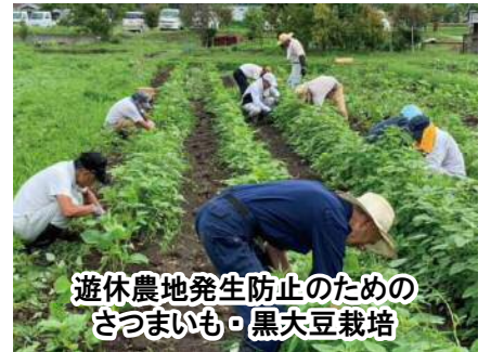
遊休農地発生防止のための さつまいも・黒大豆栽培