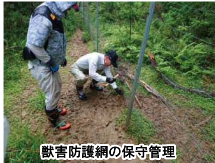
獣害防護網の保守管理