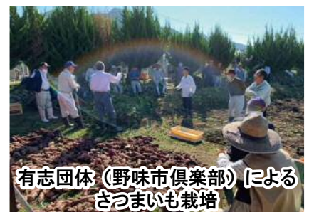
有志団体（野味市倶楽部）による さつまいも栽培