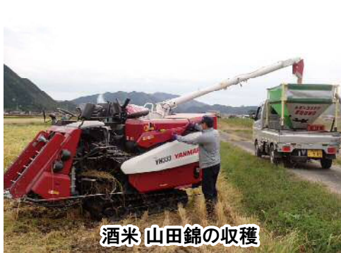
酒米 山田錦の収穫