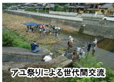
アユ祭りによる世代間交流