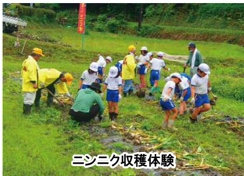
ニンニク収穫体験