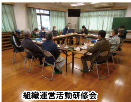
組織運営活動研修会