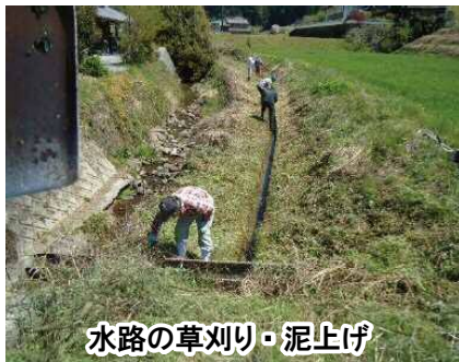
水路の草刈り・泥上げ