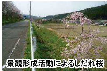
景観形成活動によるしだれ桜