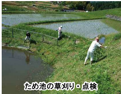
ため池の草刈り・点検