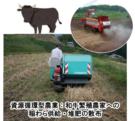
資源循環型農業：和牛繁殖農家への稲わら供給・堆肥の散布