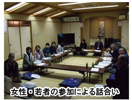
女性・若者の参加による話し合い