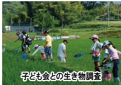
子ども会との生き物調査