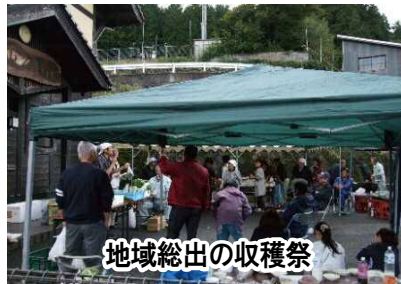
地域総出の収穫祭