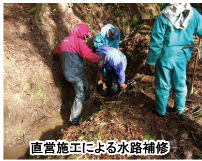
直営施工による水路補修