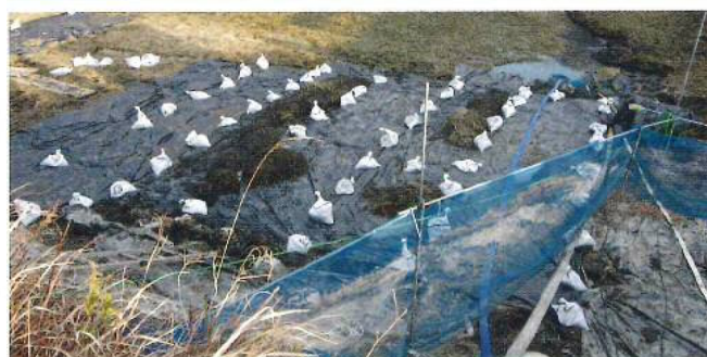
遮光シートやネットを用い、拡散を防ぎながら駆除をします

兵庫県 (078-362-3389) またはお住まいの自治体窓口にご連絡ください。