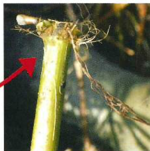
茎の節から再生する根