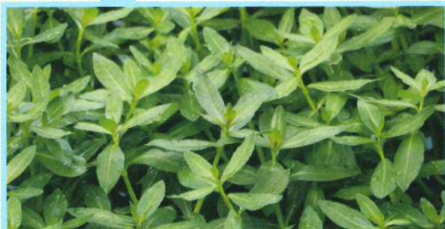
水上から陸上まで、容赦なく大繁茂します