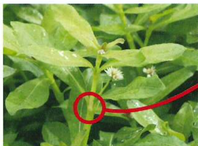
節は簡単にポキポキ折れる