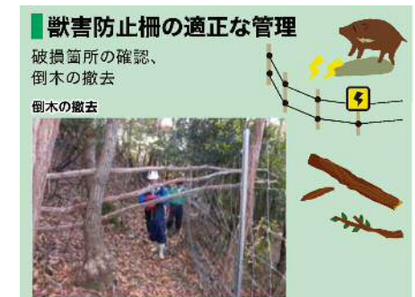
『活動取組事例集』より