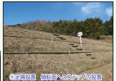
④足場設置 傾斜面へのステップの設置