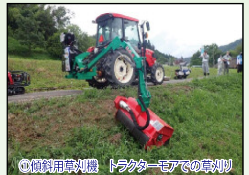
①傾斜用草刈機 トラクターモアでの草刈り