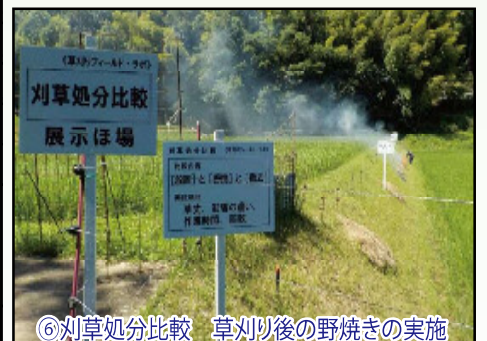
⑥刈草処分比較 草刈り後の野焼きの実施