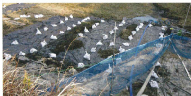
遮光シートやネットを用い、拡散を防ぎながら駆除をします

兵庫県 (078-362-3389) またはお住まいの自治体窓口にご連絡ください。