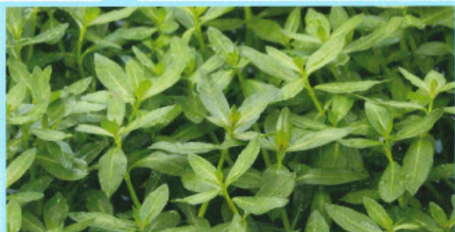
水上から陸上まで、容赦なく大繁茂します