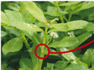
節は簡単にポキポキ折れる