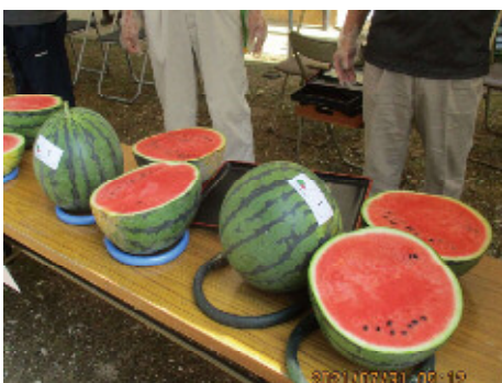
ひょうご推奨ブランド「大山スイカ」