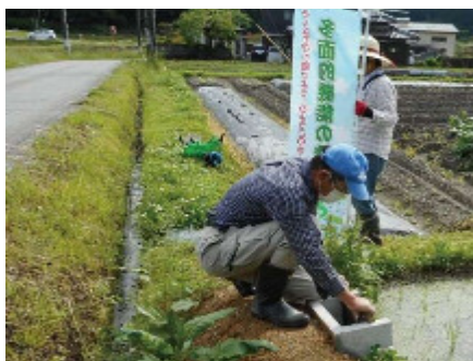
田んぼダム設置の取組