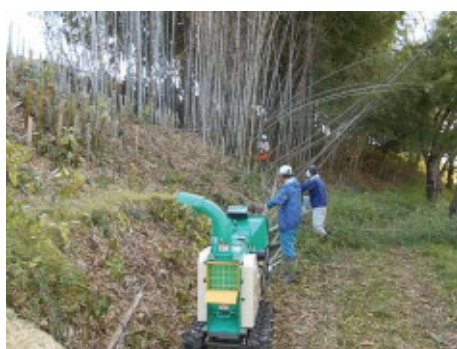
竹林の整備・竹チップ化