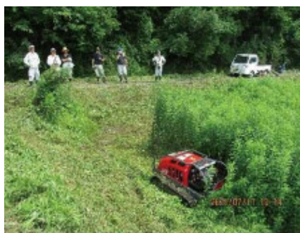
大型ラジコン草刈機による草刈り