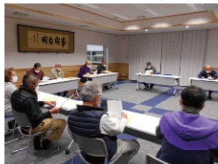
広域協定運営委員会