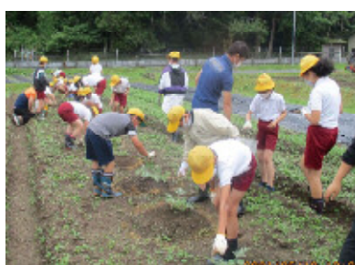
大山スイカの栽培