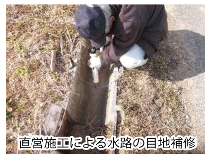
直営施工による水路の目地補修