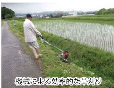
機械による効率的な草刈り