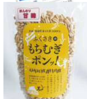
特産品「もちむぎポン」