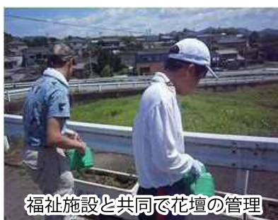
福祉施設と共同で花壇の管理