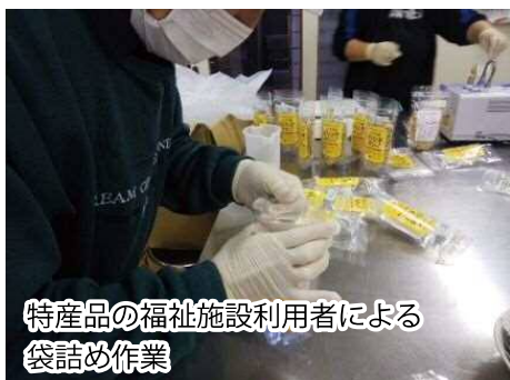
特産品の福祉施設利用者による袋詰め作業