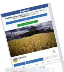
ネットによるPR・販売