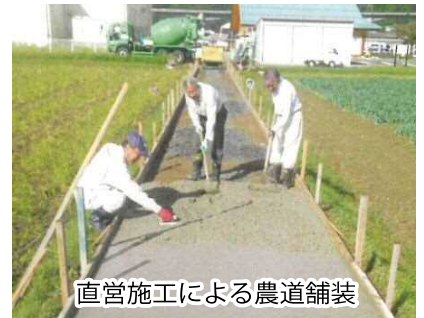
直営施工による農道舗装