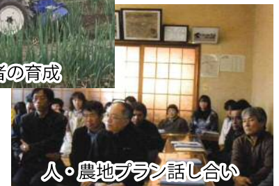
人・農地プラン話し合い