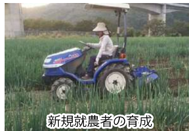
新規就農者の育成