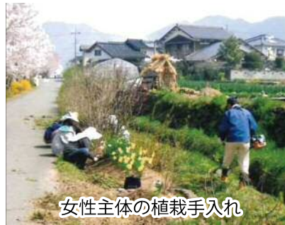
女性主体の植栽手入れ