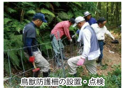
鳥獣防護柵の設置・点検