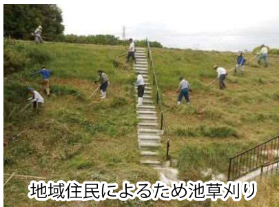
地域住民によるため池草刈り