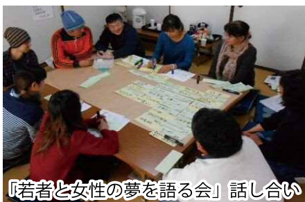
『若者と女性の夢を語る会』話し合い