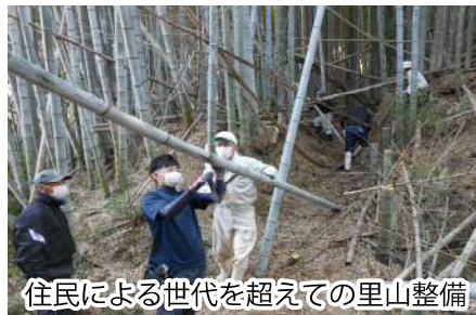
住民による世代を超えての里山整備