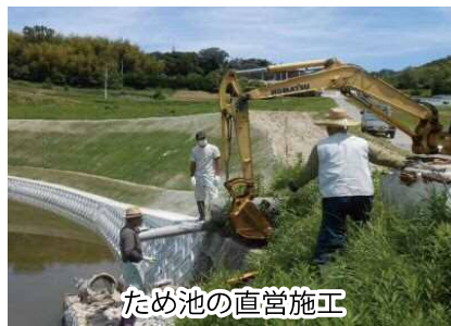
ため池の直営施工