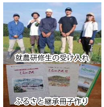
就農研修生の受け入れ