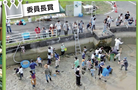
丹波の里山景観を「協働と交流」で次世代につなぐ! 下三井庄地区農地・水・環境保全向上活動の会 (丹波市)