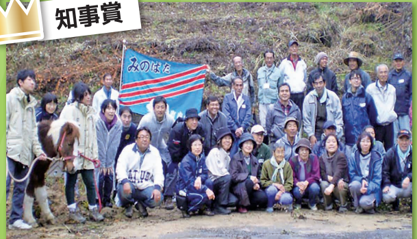
淡路島の小さな集落の魅力あふれるふるさとづくり! 三野畑農地水環境保全隊 (洲本市)