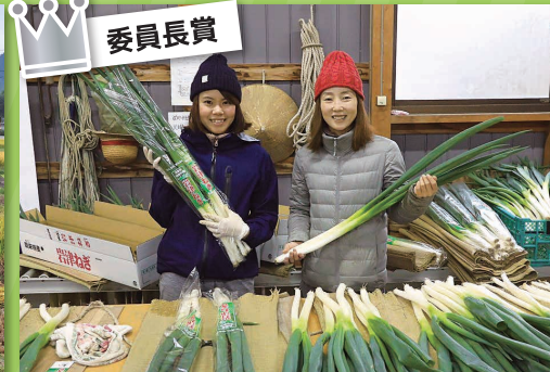
儲ける農業! 食と農と環境保全 市御堂農地・水・環境保全の会 (朝来市)