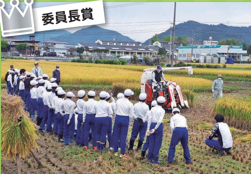
農業を通して人にも環境にも優しい地域づくり 高橋区環境保全隊 (福崎町)