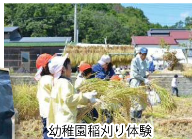
幼稚園稲刈り体験