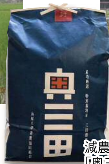
減農薬栽培による「奥三田米」