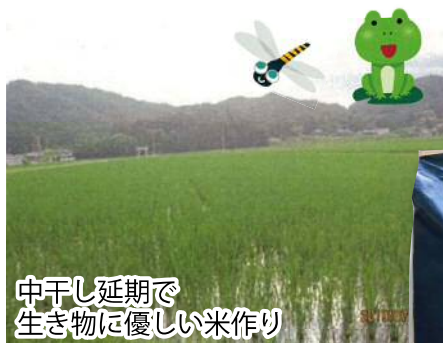
中干し延期で生き物に優しい米作り