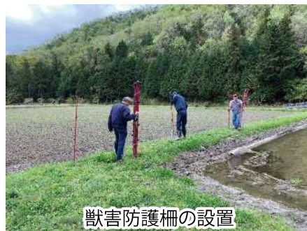
獣害防護柵の設置