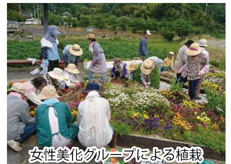
女性美化グループによる植栽