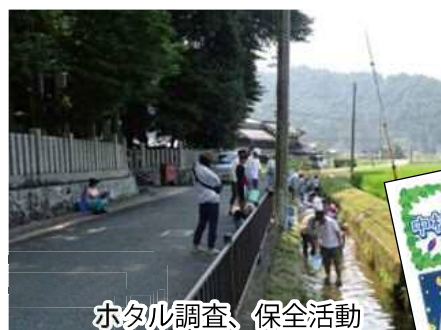
ホタル調査、保全活動