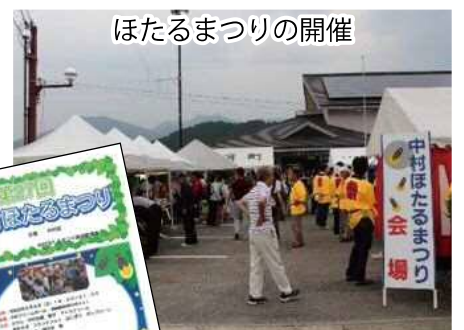
ほたるまつりの開催