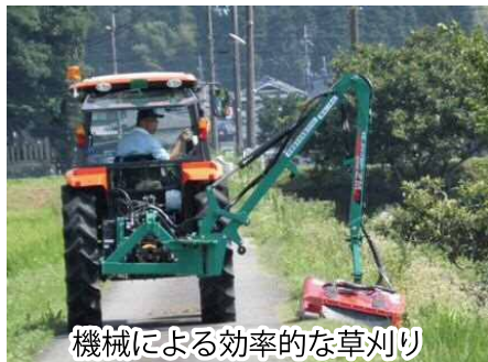
機械による効率的な草刈り