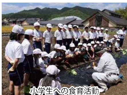
小学生への食育活動