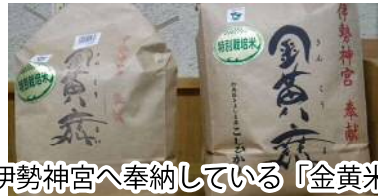
伊勢神宮へ奉納している『金黃米』