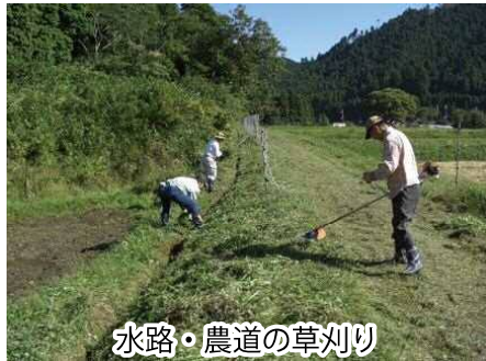
水路・農道の草刈り