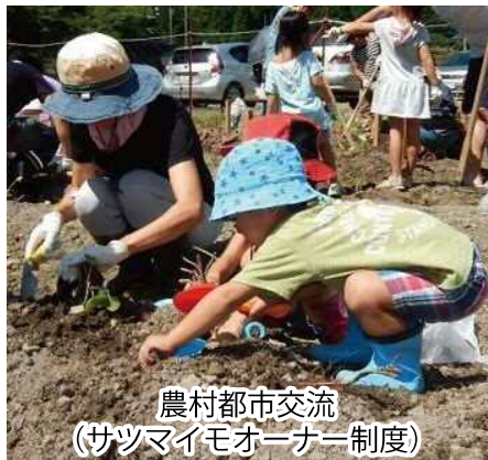
農村都市交流 (サツマイモオーナー制度)