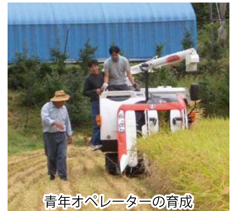
青年オペレーターの育成