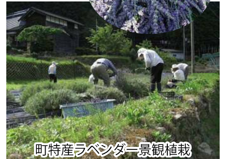
町特産ラベンダー景観植栽