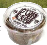
特産 八鹿浅黄 みそ加工