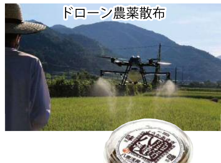
ドローン農業散布