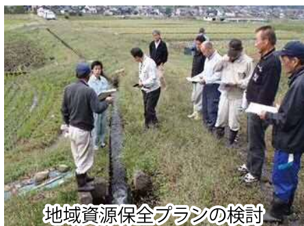
地域資源保全プランの検討