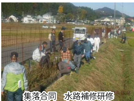
集落合同 水路補修研修