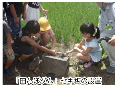
「田んぼダム」セキ板の設置