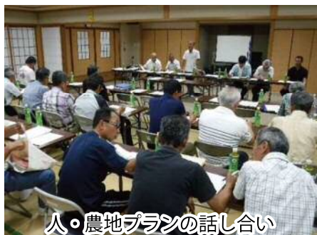
人・農地プランの話し合い