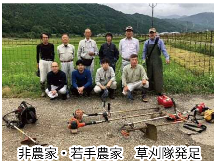
非農家・若手農家 草刈隊発足