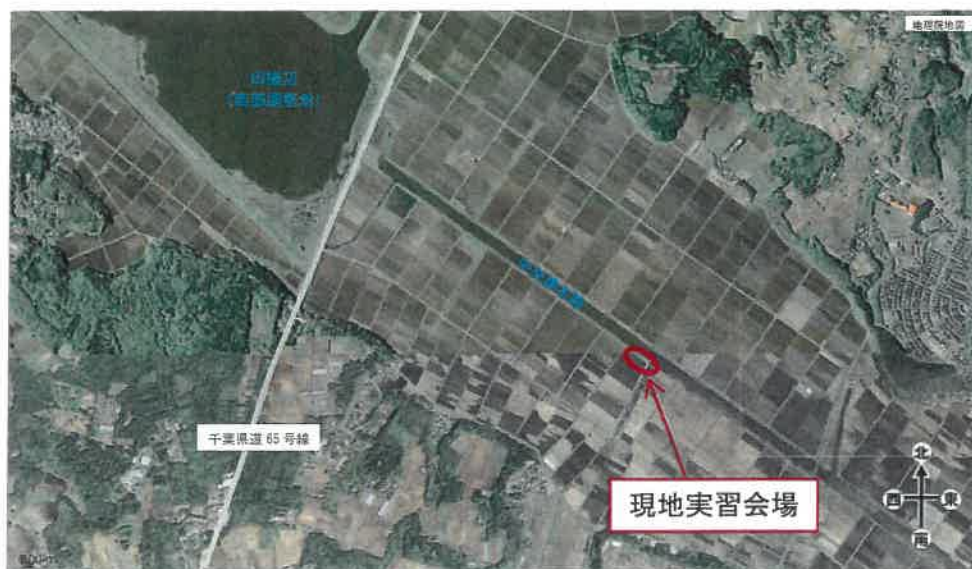
現地実習場所 位置図