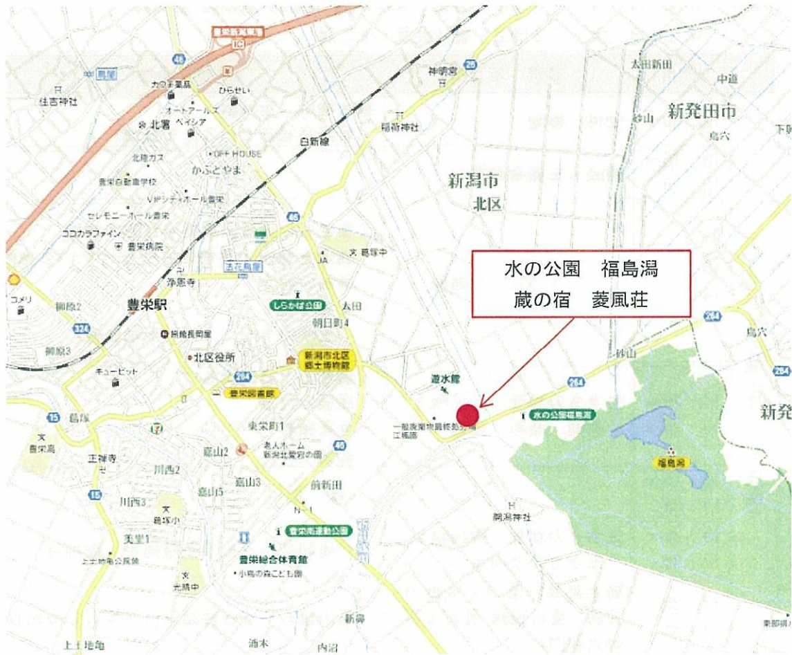
『水の公園 福島潟 蔵の宿 菱風荘』位置図