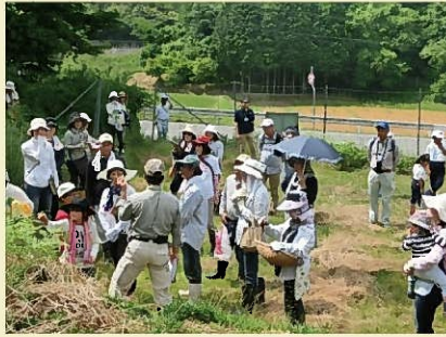
浅野美しい村づくり活動組織（市川町）