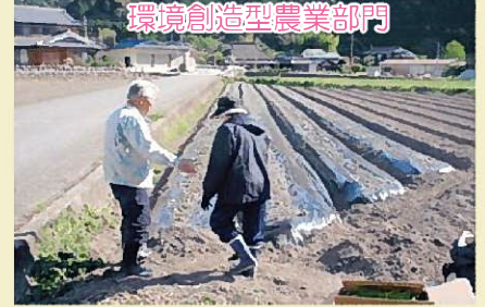
多田農地協議会（多可町）