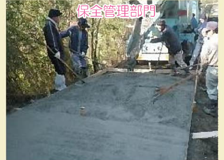
休しみどりの会（上郡町）