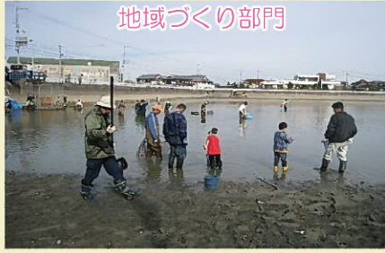
国岡協議会（稲美町）