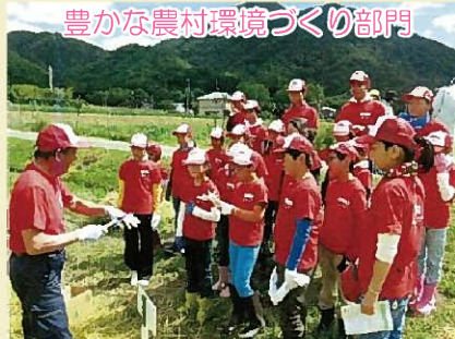
十倉地区資源保全隊（三田市）