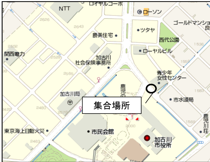
② 加古川市青少年女性センター前