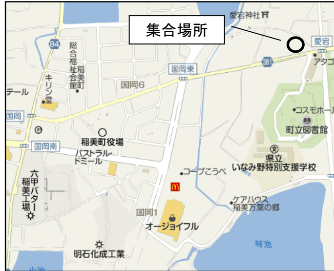
④ いなみ文化の森第2駐車場