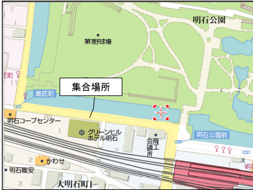
① グリーンヒルホテル明石神姫バス駐車場