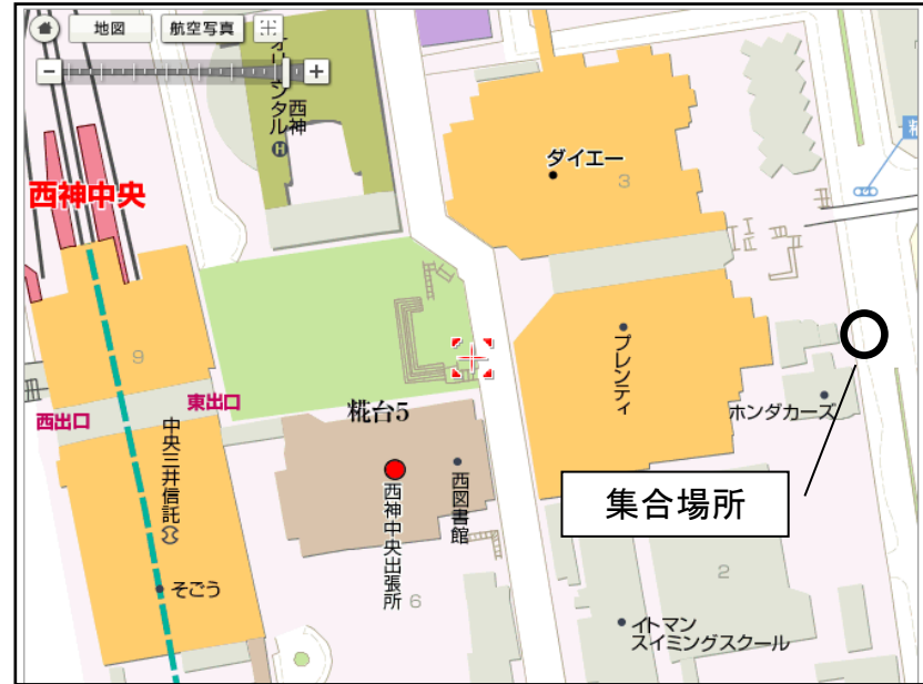
③ 地下鉄西神中央駅(ホンダカーズ前)