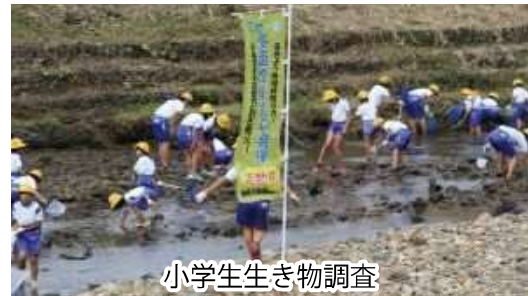
小学生生き物調査