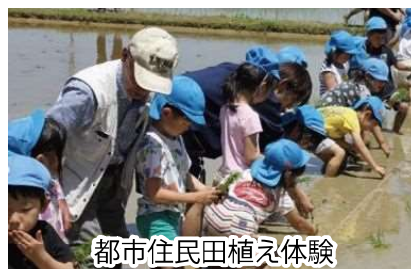
都市住民田植え体験