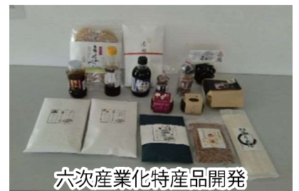
六次産業化特産品開発