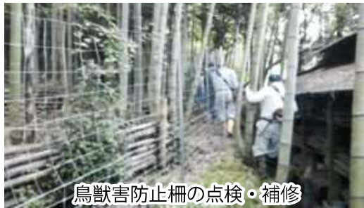
鳥獣害防止柵の点検・補修